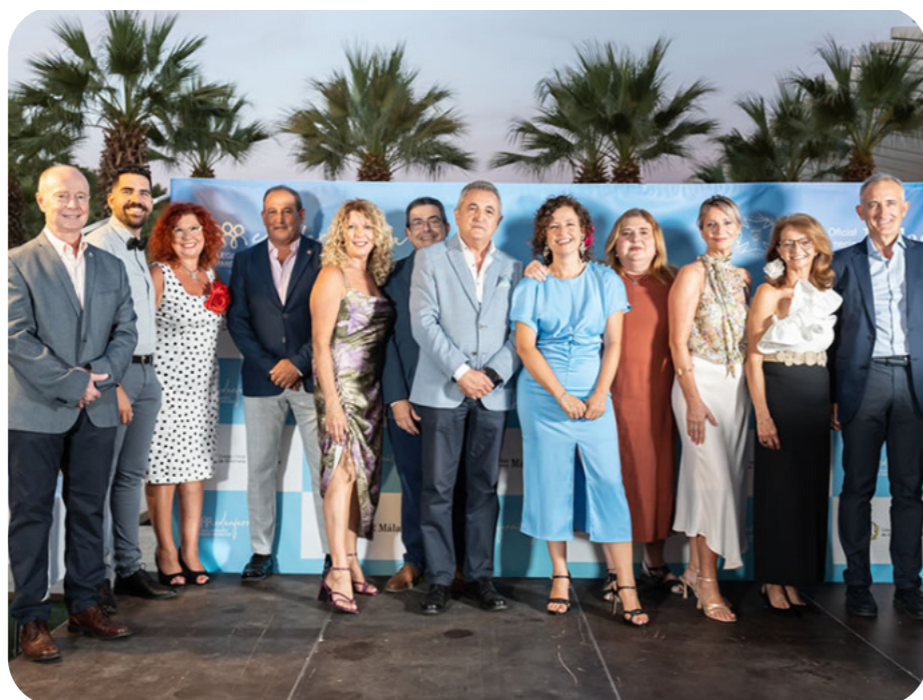
La Junta de Gobierno del Colegio de Enfermería de Málaga posa durante el evento

En una noche llena de emociones y gratitud, el Colegio de Enfermería de Málaga conmemoró el Día del Colegiado y la entrega de los prestigiosos Premios "Enfermería de Málaga 2023". La ceremonia, celebrada en la jornada del viernes 18 de agosto de 2023 en el hermoso Palmeral de las Sorpresas del Puerto de Málaga, sirvió para rendir homenaje a los profesionales de la Enfermería que día a día dedican sus corazones y manos al cuidado y bienestar de quienes más lo necesitan.