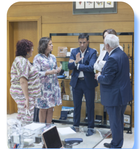
Acabar con la fuga de profesionales y la problemática de las tasas de reposición