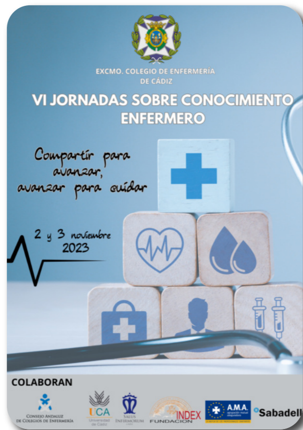
Cartel de las VI Jornadas