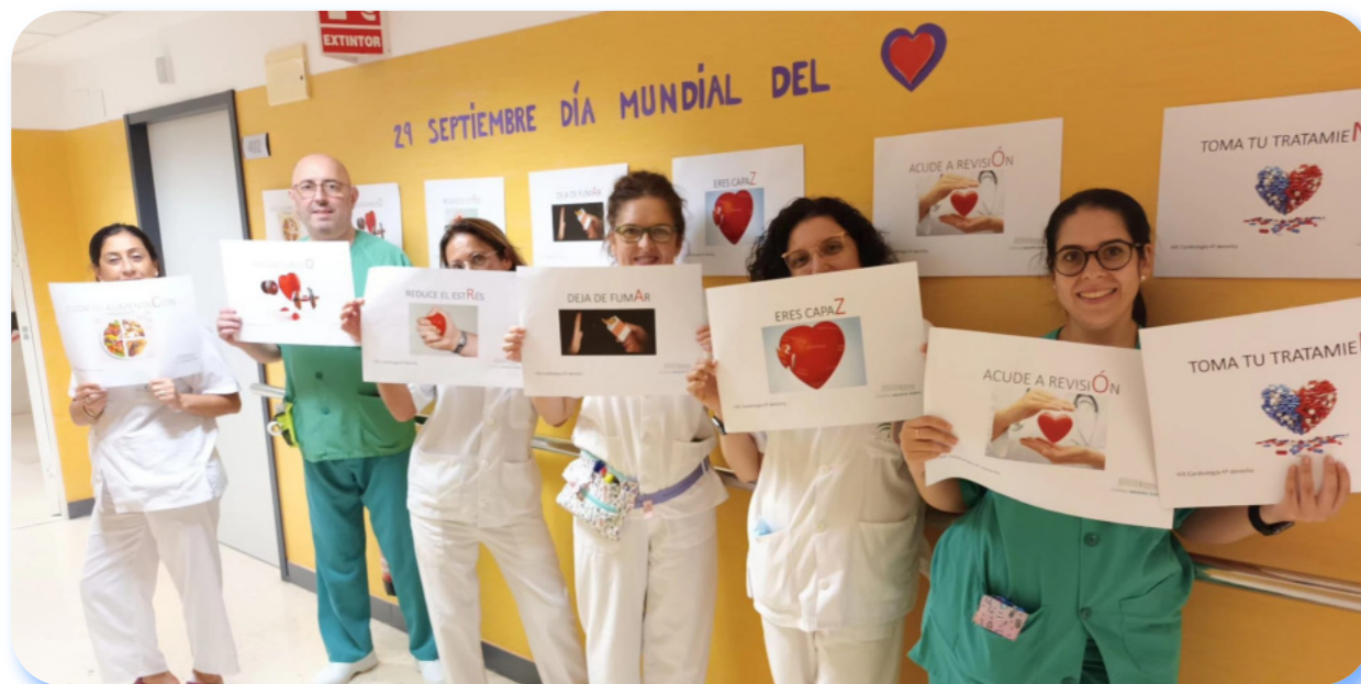
Enfermeras/os del hospital Infanta Elena celebran el día del Corazón

Seguir los consejos de los sanitarios profesionales para mantener nuestro corazón en las mejores condiciones, siguiendo hábitos de vida saludables