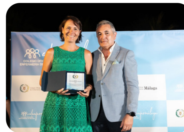
Momento en el que se reconoció a la Facultad de Ciencias de la Salud de la UMA

Ateneo de Málaga además de los principales medios de comunicación de la provincia. Por su parte, el acto comenzó con palabras de agradecimiento a todos los colegiados y colegiadas que se unieron a la especial celebración, reafirmando la importancia de compartir momentos de hermandad y honrar la vocación que late en cada uno de ellos. En esta edición de los Premios "Enfermería de Málaga", correspondiente al actual año