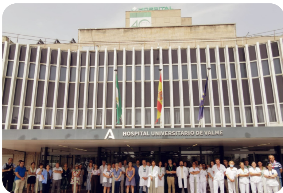
Sanitarios del Valme concentrados en solidaridad con la enfermera agredida