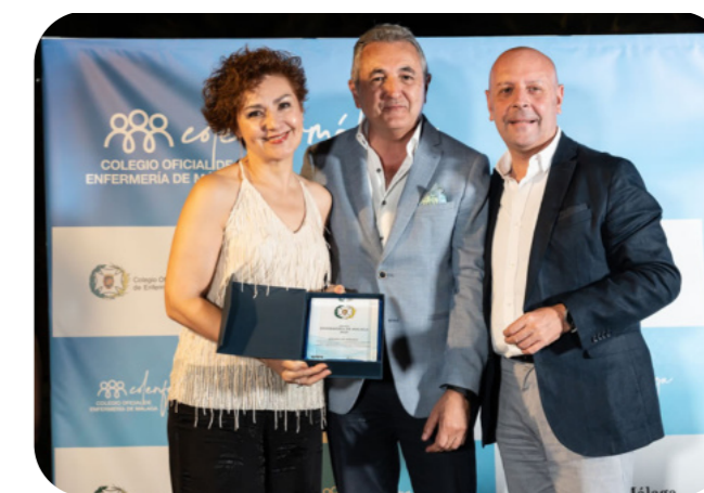
Momento en el que se reconoció al Ateneo de Málaga y su encomiable labor

"Espíritu de dedicación que caracteriza a la Enfermería"