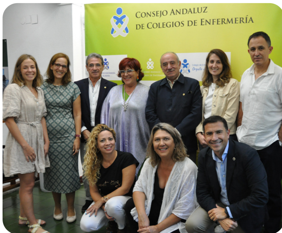
Algunos de los presidentes y presidentas de los Colegios Oficiales de Enfermería de Andalucía junto a enfermeras escolares referentes

Desde el CAE han recordado que la implantación de la figura