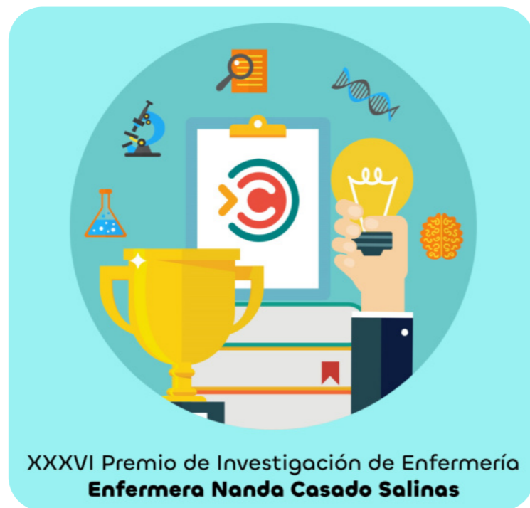
XXXVI Premio de Investigación de Enfermería Enfermera Nanda Casado Salinas

El XXXVI Premio de Investigación de Enfermería del Colegio Oficial de Enfermería de Córdoba, que a partir de este año pasa a denominarse Premio de Investigación de Enfermería 'Enfermera Nanda Casado Salinas', en señal de recuerdo y homenaje a esta enfermera cordobesa fallecida por COVID-19; ha abierto ya el plazo de presentación de trabajos hasta el próximo 30 de noviembre, para un galardón al que podrán optar todas las enfermeras y enfermeros andaluces.