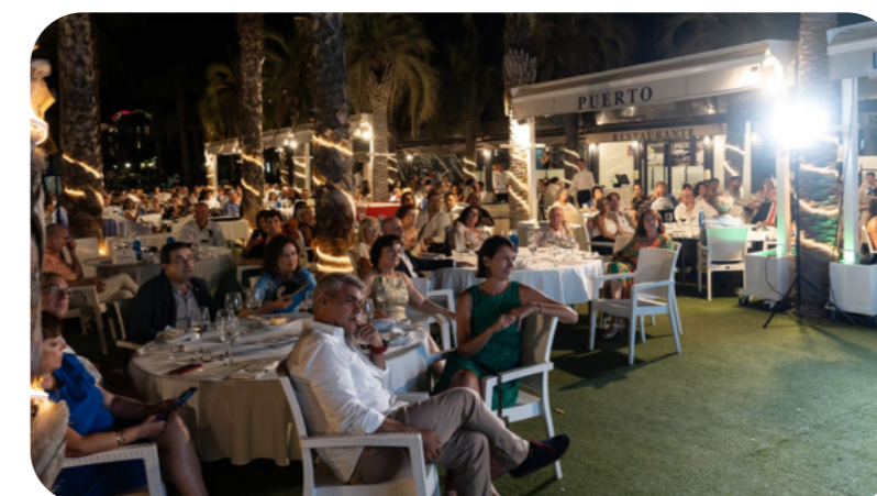
Ambiente que se respiró en la celebración del Día del Colegiado, en el Muelle Uno de Málaga

Como reseñó Carrasco Sancho, "cada uno de los premiados encarna el espíritu de excelencia y dedicación que caracteriza a la Enfermería. Por eso, desde el Colegio queremos seguir reiterando nuestro compromiso de seguir honrando la labor de nuestros profesionales y promoviendo el desarrollo de la comunidad enfermera en la provincia".