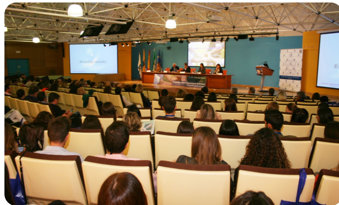
Jornadas de Conocimiento Enfermero de 2019