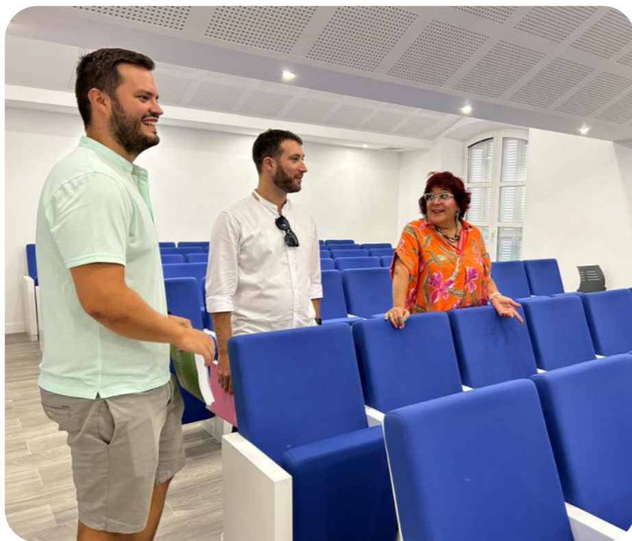
Durante la entrevista, los enfermeros almerienses trasladan a la Presidenta del Colegio Oficial de Enfermería de Almería sus impresiones acerca del diseño y publicación del manual

El proceso hasta publicar el libro ha sido largo y laborioso, pero también muy gratificante. Hemos dedicado muchas horas a revisar el temario oficial del SAS, a buscar las fuentes más fiables y actualizadas, a elaborar las explicaciones de cada pre-